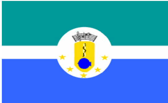
Bandera del municipio Miranda

La bandera del municipio fue fundada por Humberto Petit, consta de 2 franjas horizontales turquesa y azul. La franja turquesa simboliza la riqueza agropecuaria del municipio como los cultivos de arroz del caño Oribor. La franja azul representa las aguas del lago de Maracaibo y el Golfo de Venezuela que bañan sus costas. Entre las franjas hay una banda blanca separándolas y un círculo blanco en el medio. En el círculo hay varios símbolos entre ellos unas letras musicales que representan el talento musical de sus habitantes, un pez muy estilizado que representa la riqueza pesquera y 5 estrellas que representan las parroquias del municipio: Altagracia, Faria, Ana María Campos, San Antonio y San José.