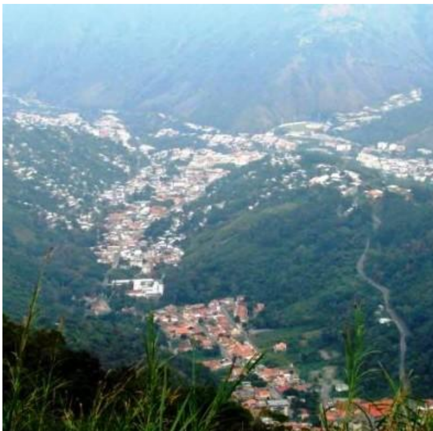
Vista Panorámica del Municipio Trujillo

LUCHEMOS POR EL TRUJILLO QUE QUEREMOS Y MERECEMOS