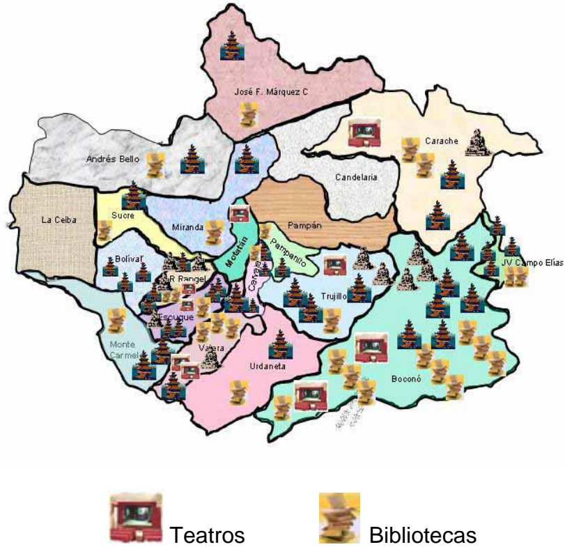
Fig. 4.- Instalaciones Culturales del Estado Trujillo