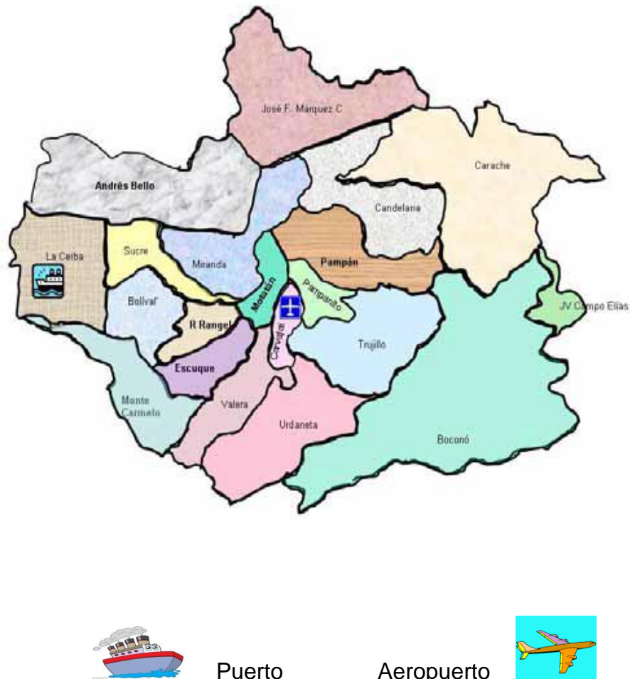
Fig 3.- Puertos y Aeropuertos del Estado Trujillo,

Puertos: Trujillo posee el puerto de cabotaje de “La Ceiba” en el litoral lacustre. No está habilitado desde el mismo Gobierno