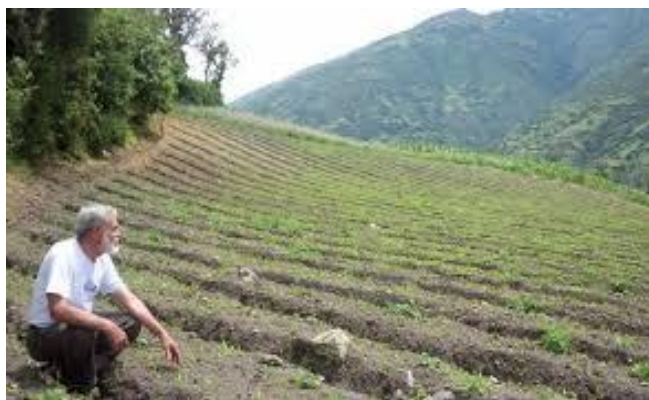
Fig.- 4 Suelos del Municipio Trujillo

Los suelos existentes en el Municipio Trujillo se caracterizan por ser suelos profundos, con texturas franco arcillosa a arcillosa, estructura blocosa subangular moderada a fuerte, bien drenados y rocosos, erosión laminar y en surcos.