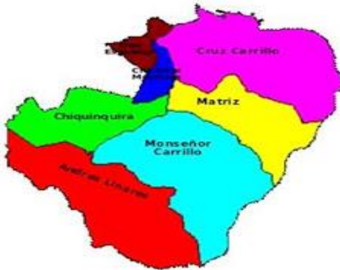
Fig 1.- Mapa del Municipio Trujillo.

Oeste, el Municipio Trujillo delimita con los Municipios Pampanito y Carvajal.