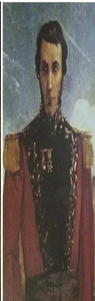
JOSE MARIA CARREÑO INDEPENDENCIA Y VICTORIA