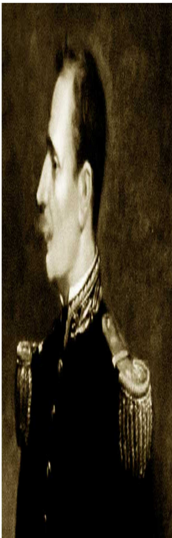
EZEQUIEL ZAMORA TIERRA Y HOMBRES LIBRES