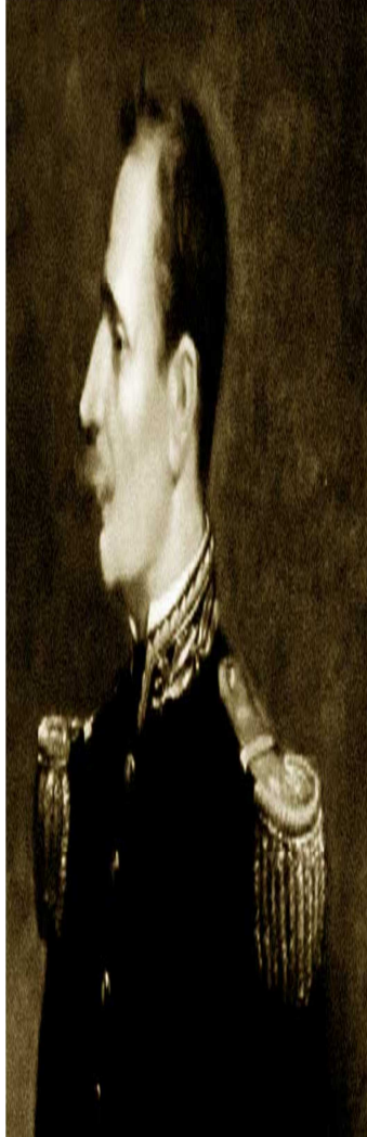
EZEQUIEL ZAMORA TIERRA Y HOMBRES LIBRES