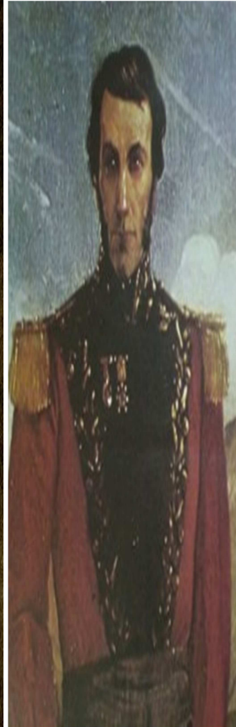
JOSE MARIA CARREÑO INDEPENDENCIA Y VICTORIA