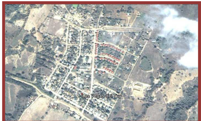
VEGAS DEL TUY

2. Elaboración del Plan de Desarrollo Urbano Local (PDUL). Es de vital importancia la ordenación del territorio debido a que es uno de los más extenso del estado con una población muy dispersa, urbanísticamente desordenada, carente de servicios básicos tales como la Red de Cloacas y lo que es determinante en este plan es para definir la propiedad o titularidad real de la tierra ya que el concepto de tenencia de la tierra está basada en terminología presumiblemente de dudosa legalidad y esta densidad representa más de 80% de ocupación del territorio (170 Hectáreas aproximadamente) y de ser comprobada como legales estaríamos en presencia de un latifundio lo cual nos remitiría a evaluar el patrón de asentamiento para una justa distribución de dichas tierras.