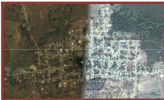
SANTA CRUZ DE BUCARAL