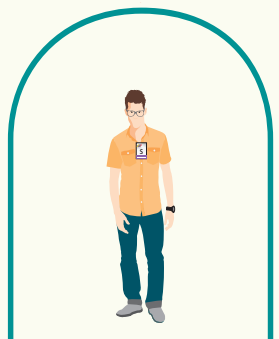
SECRETARIA O SECRETARIO

Con tu cédula de identidad aun vencida, ante la presidenta o presidente de la Mesa Electoral, para que registre tus datos en el Sistema de Autenticación Integrado.