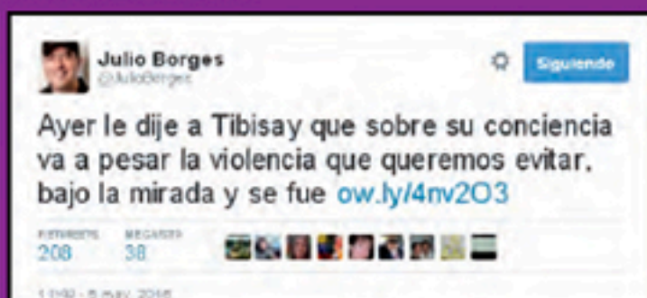
Amenaza del secretario general del partido Primero Justicia