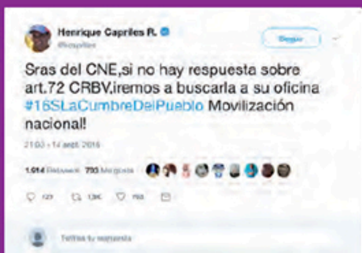
Amenaza de ex candidato presidencial

Especial mención debe hacerse en relación con la campaña dirigida, durante el año 2016, contra la presidenta del órgano electoral, Dra Tibisay Lucena, la cual constituye un repudiable ejemplo de violencia de género y de incitación al odio. Esta agresiones, dirigidas a dañar su honor y su reputación incluyendo su entorno familiar, es una constante a la que han estado sometidas las autoridades del ente electoral.