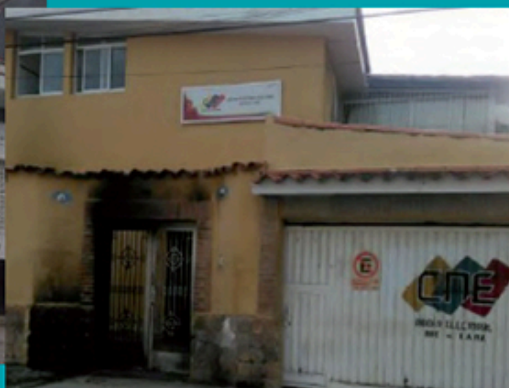
Ataque Sede CNE LARA Marzo 2014