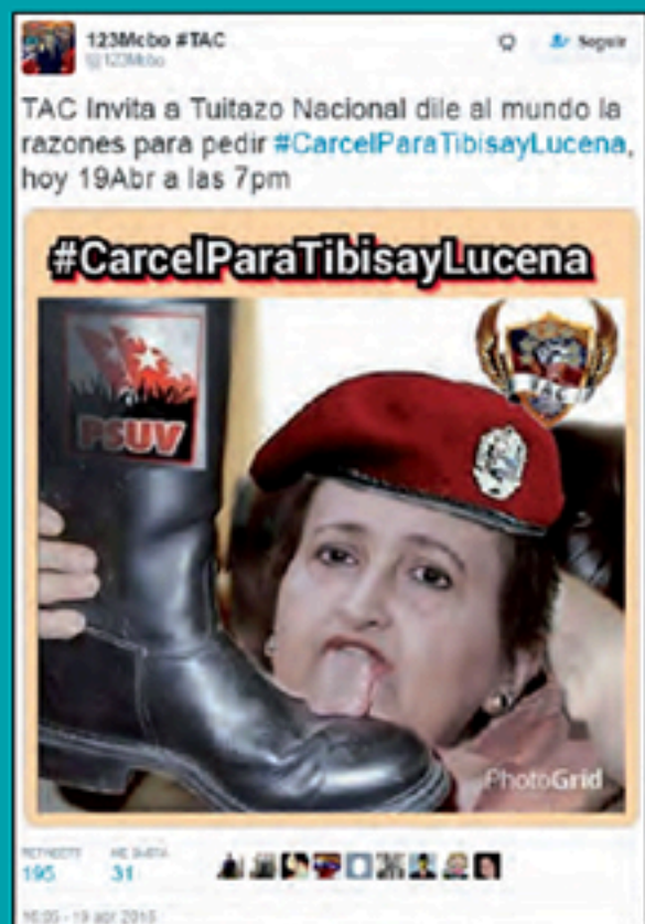
Campaña anónima de odio Abril 2016