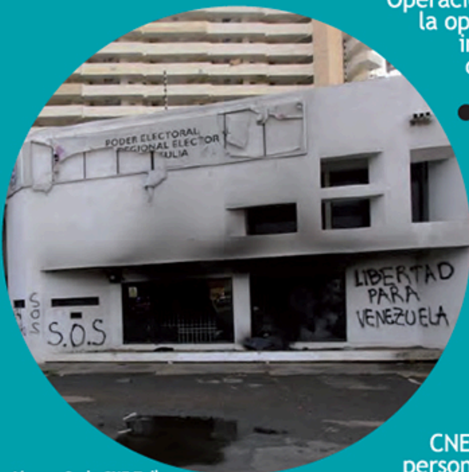
Ataque Sede CNE Zulia Marzo 2014