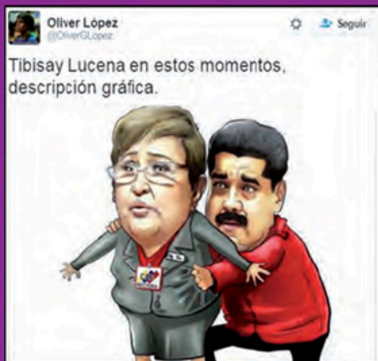
Campaña anónima de odio Abril 2016