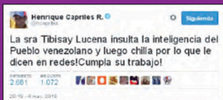
Campaña de odio con participación de relevantes actores políticos