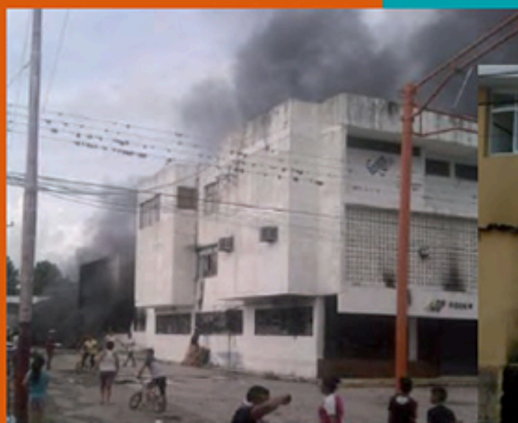
Ataque Sede CNE TÁCHIRA Marzo 2014