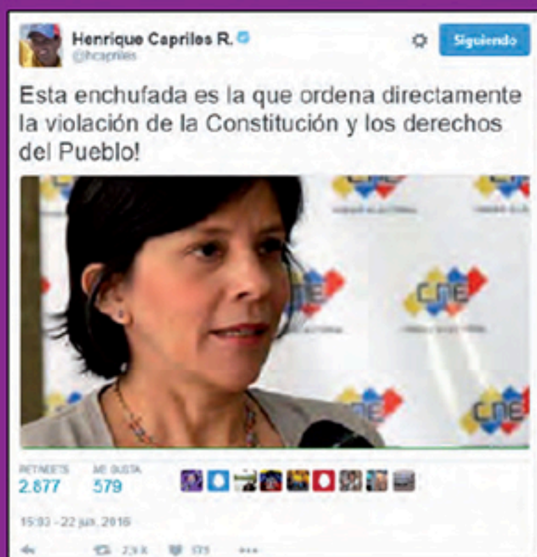
Campaña anónima de odio Junio 2016