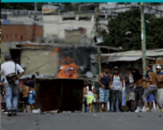
ATAQUES A SEDES E INFRAESTRUCTURA ELECTORAL. DÍAS PREVIOS Y DURANTE EL 30 DE JULIO DE 2017. ELECCIÓN DE LA ASAMBLEA NACIONAL CONSTITUYENTE.